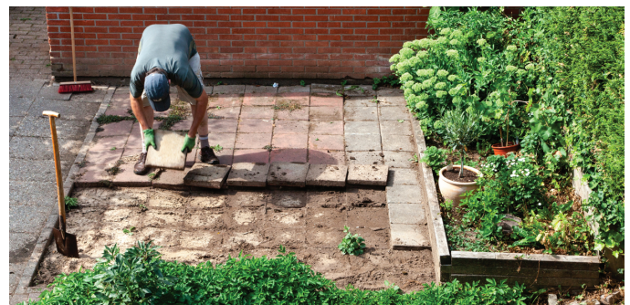
Boekelse tegeltaxi haalt gratis tuintegels en bestrating op.

Het NK Tegelwippen stimuleert inwoners om tegels te vervangen door gras, bloemen, struiken en bomen. Minder tegels helpt om wateroverlast bij hevige regenbuien te verminderen, zorgt voor verkoeling tijdens warme zomers en draagt bij aan een gezonde en aantrekkelijke leefomgeving. Het NK Tegelwippen is een samenwerking tussen overheden, brancheorganisaties, natuurorganisaties, waterbeheerders en tuinorganisaties. Samen zetten zij zich in om Nederlandse tuinen klimaatbestendiger te maken en de biodiversiteit te vergroten.