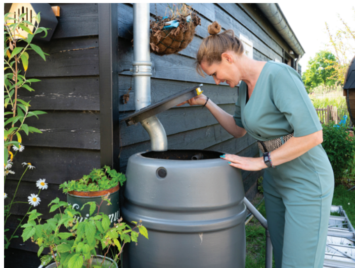
Slim gebruik van regenwater in klimaatvriendelijke tuin

Inspireer jij graag anderen met jouw tuin en tips? Meld je dan aan vóór 16 maart 2026 via info@boekel.nl . De eerste vijf aanmelders belonen we met een gratis biologisch plantepakketje. Samen maken we Gemeente Boekel groener, koeler en toekomstbestendig.