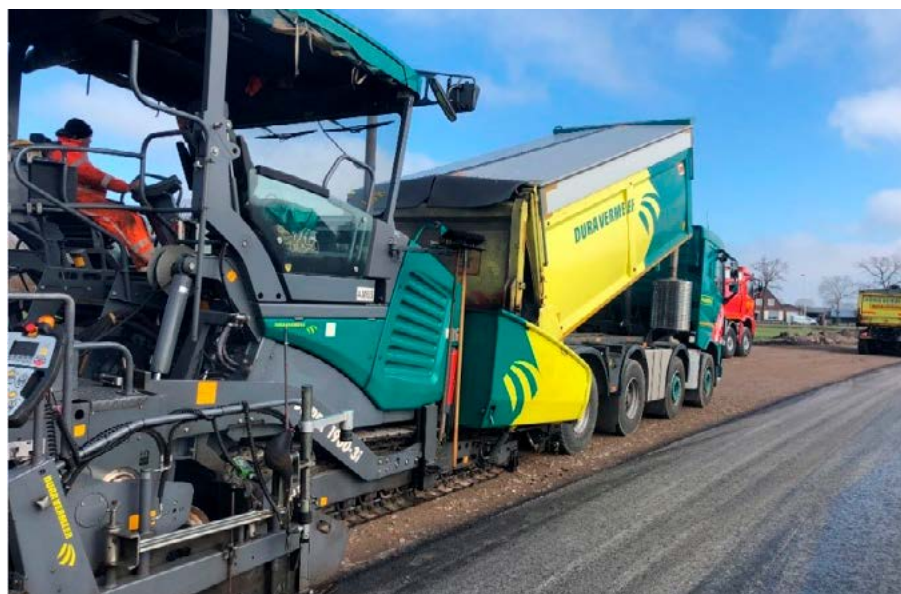
Aanbrengen asfalt op de nieuwe randweg.

Zoals we in de vorige nieuwsbrief hebben gemeld dat de contouren van de nieuwe randweg in het terrein steeds meer zichtbaar werden, kunnen we nu melden dat de werkzaamheden in een vergevorderd stadium zijn. De opening van de nieuwe randweg komt dan ook dichterbij. De afgelopen periode hebben we te maken gehad met winterse weersomstandigheden. Om deze reden hebben we gedurende een korte periode geen werkzaamheden kunnen uitvoeren.