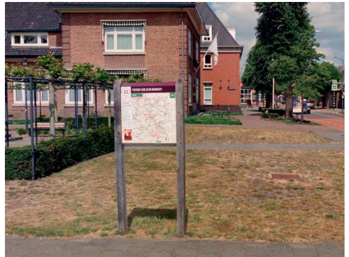
Paneel fietsknooppunten netwerk

Op korte termijn worden knooppuntenpanelen geplaatst en/of gewijzigd zodat de nieuwe routes straks goed gebruikt kunnen worden. Tegelijkertijd zullen bestaande panelen worden vernieuwd die op korte termijn aan vervanging toe zijn.