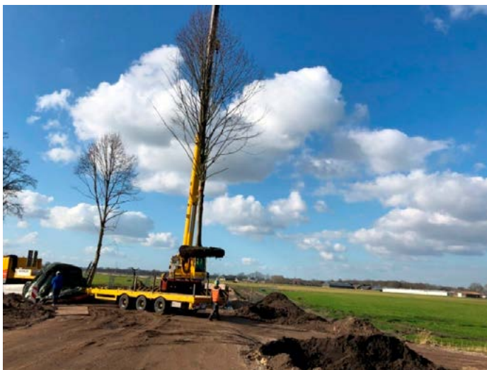
bomen plant, creëren van en hop-over nabij Leurke

Om deze vliegroutes functioneel te houden zijn bij alle bomenrijen zgn. hop-overs gerealiseerd. Een hop-over is een natuurlijke