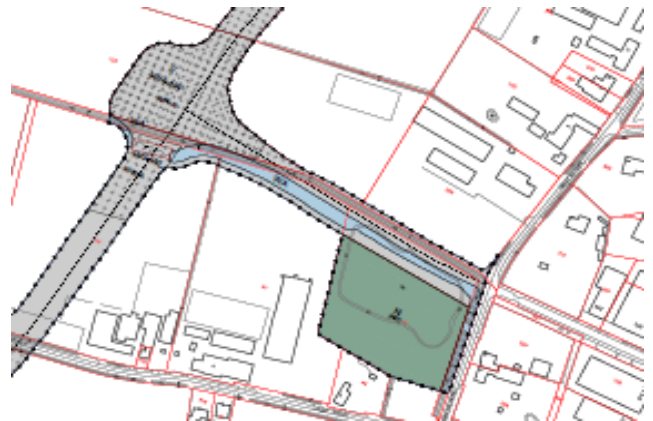
Een uitsnede uit "de verbeelding", onderdeel van het VOBP

Wilt u meer weten over de Randweg? Kijk dan op www.boekel.nl/randweg .