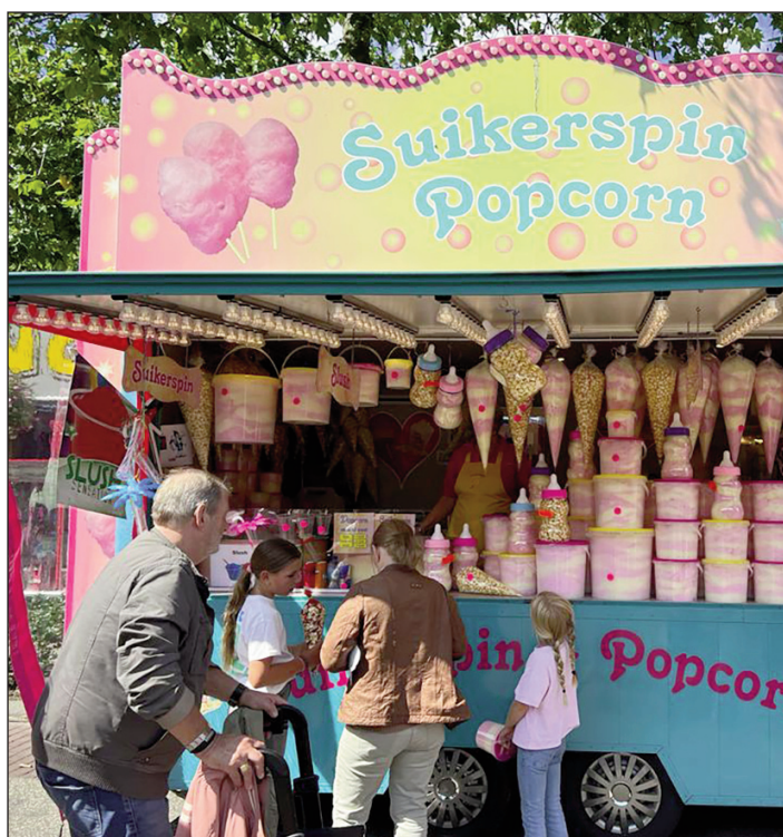
De kermis in de gemeente Boekel is een belangrijk evenement.

In de enquête stonden punten centraal zoals het soort evenementen, de locatie en eindtijden maar ook werd gevraagd naar eventueel ervaren overlast, zoals lawaai, afval en vandalisme. Daarnaast ging een aantal vragen specifiek over de kermis. Een korte greep uit de antwoorden. De inwoners geven aan dat het aantal en soort evenementen als goed wordt ervaren en dat de voorkeur uitgaat naar het organiseren van evenementen in het centrum van Boekel of Venhorst. Verder maakt het hen niet veel uit of een evenement overdag of 's avonds wordt georganiseerd en wat de aanvangstijd is. Lawaai wordt als belangrijkste overlast genoemd en in mindere mate afval en vandalisme. De kermis blijkt een belangrijk verbindend evenement te zijn dat nu en in de toekomst goed bezocht lijkt te worden. Deze punten maar ook de andere gegeven antwoorden en genoemde opmerkingen en suggesties worden meegenomen in het nieuwe evenementenbeleid van de gemeente Boekel.